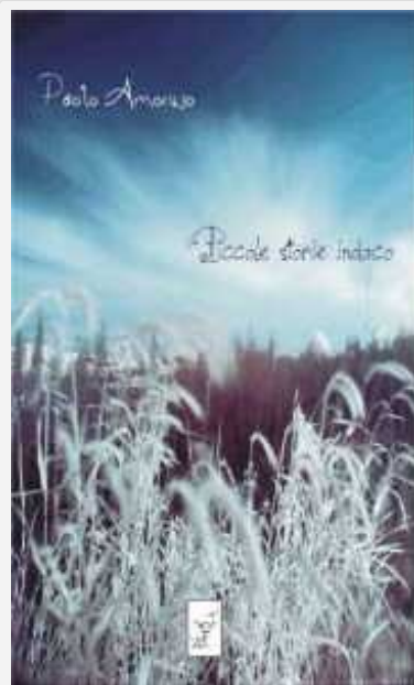
Paolo Amoruso, Piccole Storie Indaco, edizioni la gru, 10 €, pp. 64

Puoi lasciare una risposta, o mandare un trackback dal tuo sito.