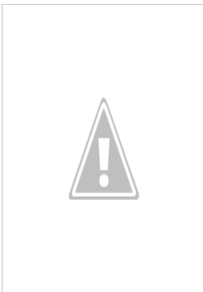
Sono quello che vuoi di Enrica Aragona

"Sono quello che vuoi" di Enrica Aragona è un romanzo erotico/noir, pubblicato da Edizioni La Gru, dai toni forti, decisi, che ti avviluppa e ti travolge nel torbido vortice di perversioni di una mente malata di dolore, drogata di dolore, consapevole della propria autodistruzione, ma incapace di opporvisi perché solo attraverso quel dolore riesce a vivere.